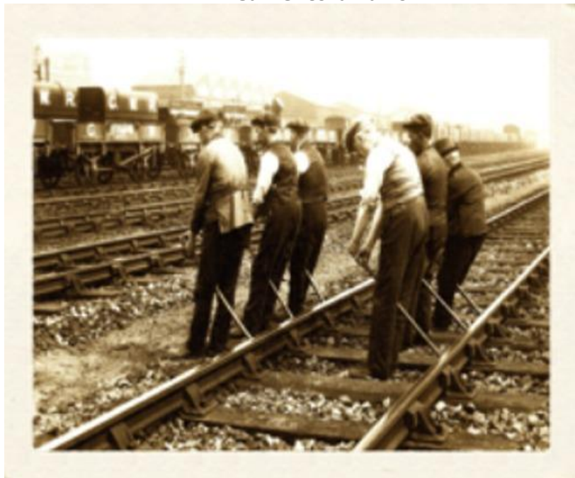
Sostituzione rotaie in linea