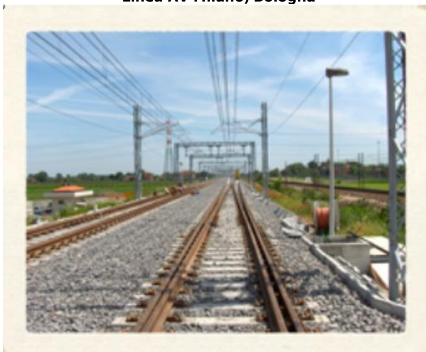
Costruzione Ponti Provvisori Bologna